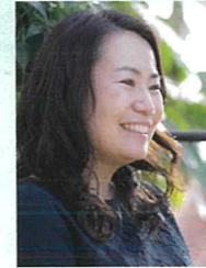
ユリディス 佐々木望微