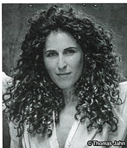
ソプラノ サラ・ハーシュコヴィッツ

1971年、ドイツ・マールブルク出身。ドイツとカナダで育ち、18歳にしてドイツ最古の街として知られるトリーア歌劇場にコレペティトゥアとして勤めた後、ドイツ・デトモルト音楽大学で学んだ。2006年からフィリップ・ジョルダン（現ウィーン国立歌劇場音楽監督）など名匠が音楽監督を務めたオーストリアのグラーツ歌劇場の首席カペルマイスターに就任し、さらに2013年からは音楽監督に就任。幅広いレパートリーに取り組み、公演はいずれも好評を博した。その他、ケルテスやブルーノ・ヴァイルなどが率いたドイツの古都アウグスブルク歌劇場の音楽監督を2009年から2014年まで務めている。2017年からボン・ベートーヴェン交響楽団とボン歌劇場の音楽監督に就任。以来、オーケストラの発展とレパートリーの拡充に尽力し、様々な新しいプロジェクトを成功に導いてきた。2019/20シーズンにはベートーヴェンの歌劇「フィデリオ」の上演をはじめ、ベートーヴェンの生誕記念の様々なプロジェクトに取り組んでいる他、劇音楽「エグモント」で同オーケストラとの初録音も行っている。これまでに、バイエルン放送管弦楽団やベルリン放送交響楽団、リンツ・ブルックナー管弦楽団、ウィーン交響楽団、ハノーファー州立歌劇場、ウィーン・フォルクスオーパー、デンマーク王立歌劇場などドイツを中心にヨーロッパの歌劇場やオーケストラに客演するなど、著しい活躍をみせている。