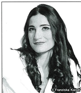
メゾ・ソプラノ ノラ・スルジアン