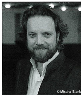
テノール ミルコ・ロシュコフスキ