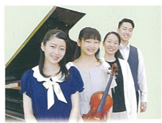
Lacrima di Esperanza

若草中学校出身。甲斐清和高校音楽科3年在籍。 2019年5月YouTube「クマーバチャンネル」に童謡歌手として出演。現在配信中。テレビ朝日音楽チャンプ優勝。関ジャニ∞のTheモーツァルト音楽王No1決定戦準決勝進出。 2018年NHKのど自慢山梨大会優勝。チャンピオン大会に出場。高校生ボーカリストアワード優勝。2016年全国こどものうたコンクール全国大会金賞。