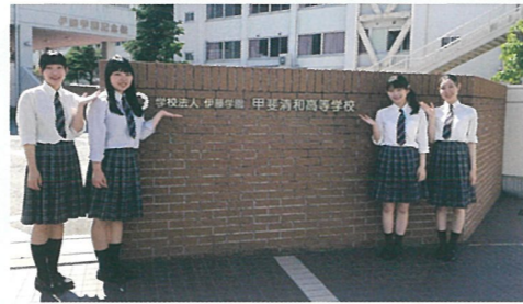
せいか音楽祭 実行委員会